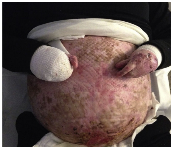
Figura 1 Paciente 1. Erosiones en abdomen tras la realización de cesárea y pseudosindactilia en ambas manos.

En las ecografías de control, se diagnosticó un feto pequeño para la edad gestacional desde la semana 32, sin repercusión hemodinámica. Se realizó una cesárea por estenosis vaginal en la semana 37+4, naciendo una mujer de 2.200 g (p8), no afectada de EBDR. El postoperatorio transcurrió sin incidencias, consiguiendo la reepitelización completa de la herida quirúrgica a las pocas semanas.