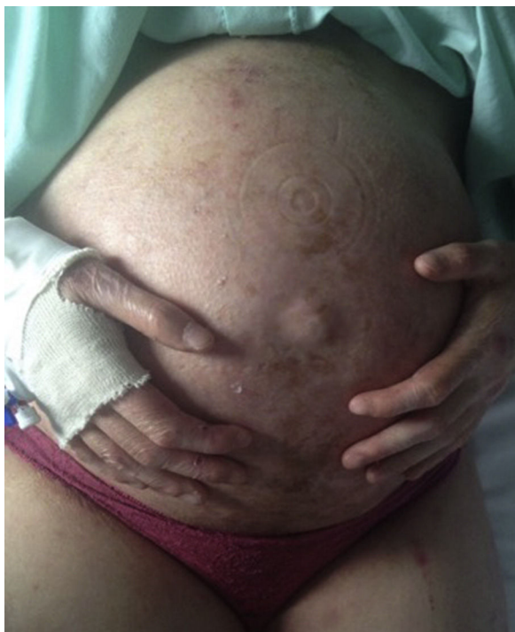
Figura 2 Paciente 2. Abdomen previo a una cesárea y anoni- quia parcial.

Así pues, el asesoramiento o consejo genético en estas pacientes es fundamental. Para ello, hemos de tener en cuenta que al ser una enfermedad recesiva únicamente será necesario el diagnóstico prenatal o preimplantacional en el caso de que haya sospecha de estado de portador en la pareja.