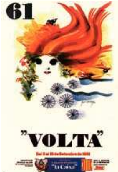
Figura 15 Cartel de la 61. a Volta, 1981. Autor: M. Cuixart.