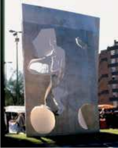
Figura 18 Monumento a la Volta. Autor: J.J. Castillo (1985).

del 75.º Aniversario (1911-1986), se organizó una contrarreloj individual en el Alguer. En 1985 la Generalitat de Catalunya atorgó a la Volta la Creu de Sant Jordi y el Ayuntamiento de Barcelona le dedicó un monumento, “El Ciclista”, obra de Jorge José Castillo, que se situó en la Plaza de Sants. (fig. 18). El cartel correspondiente a la Volta 66 de 1986 es de Antoni Tàpies, y en él figura solamente el número 75 del Aniversario, junto a diferentes círculos irregulares y enroscados que recuerdan bicicletas.