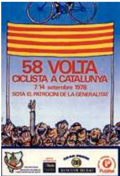
Figura 13 Cartel de la 58. a Volta, 1978. Autor: Cesc.