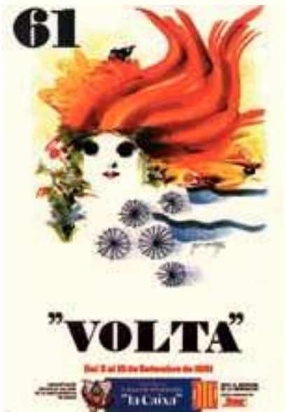
Figura 15 Cartel de la 61. a Volta, 1981. Autor: M. Cuixart.