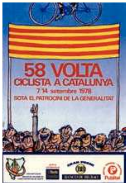
Figura 13 Cartel de la 58. a Volta, 1978. Autor: Cesc.