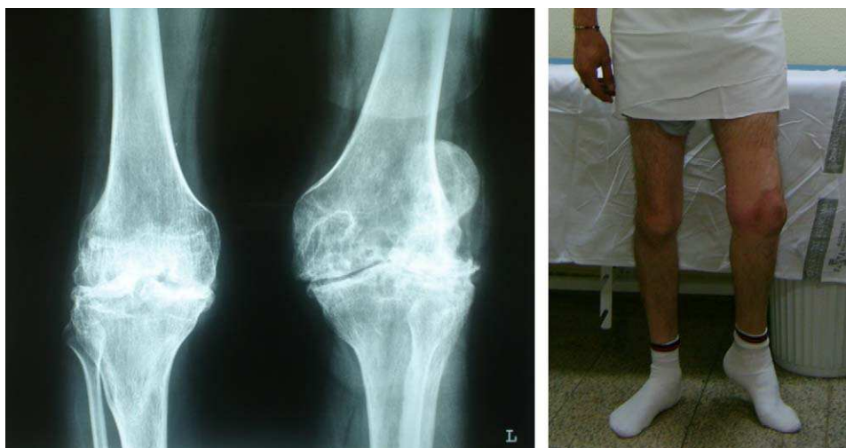
Figura 1 Imagen clínica y radiológica de artropatía hemofílica en un adulto joven.