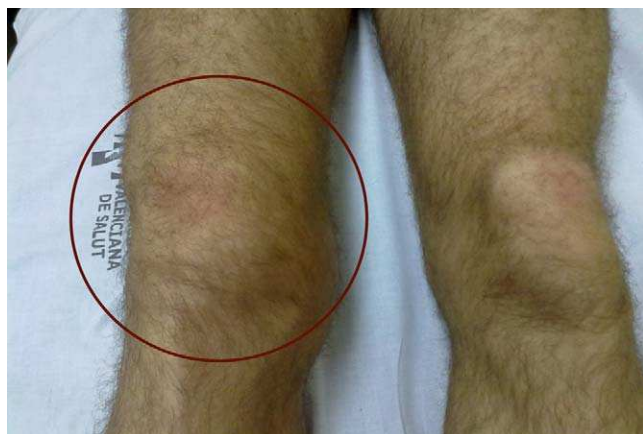
Figura 2 Hemartros de rodilla en un paciente hemofílico.

en peligro su vida 6,7 . En el paciente hemofílico predominan los sangrados musculoesqueléticos, siendo las hemartrosis (fig. 2), los hematomas y las sinovitis las lesiones musculoesqueléticas más comunes 8 . Los sangrados intraarticulares o hemartrosis son la manifestación clínica más frecuente y más conocida de la hemofilia, tanto grave como moderada, representando el 65-80% de todas las hemorragias 9,10 . Las articulaciones afectadas en mayor proporción son las rodillas, los codos y los tobillos, que suponen el 60-80% de todas