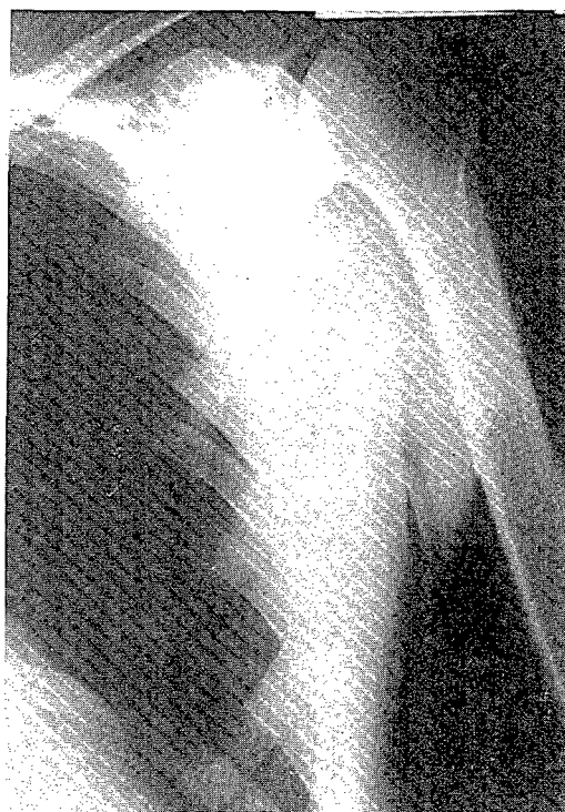
Fig. 2: Exploració radiològica del braç esquerre. Fig. 2: Exploración radiológica del brazo izquierdo.