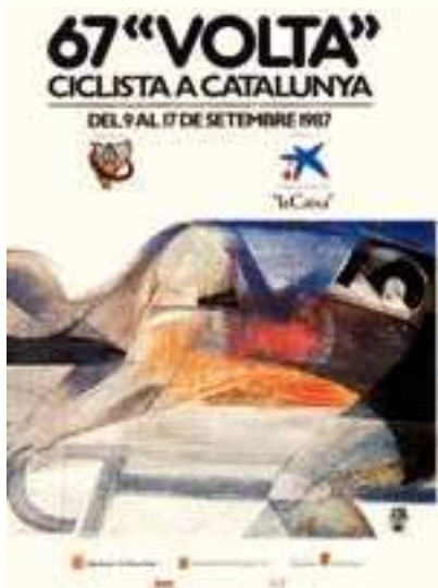
Figura 20 Cartell de la 67a Volta, 1987.

Martín Perdiguero (84a) i David Cañada (86a). Van participar en la Volta reconeguts ciclistes estrangers, com Rominguer, Bugno, Bruynel, Alvaro Mejía (guanyador de la Volta 73a), Claudio Ciapucci (74a), Laurent Jalabert (75a), Alex Zulle (76a), Hernán Buenahora (78a), Yaroslav Popovych (85a) i Vladimir Karpets (87a). El 2005 la Volta ad-