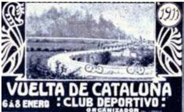
Figura 1 Cartell de la primera Volta, 1911