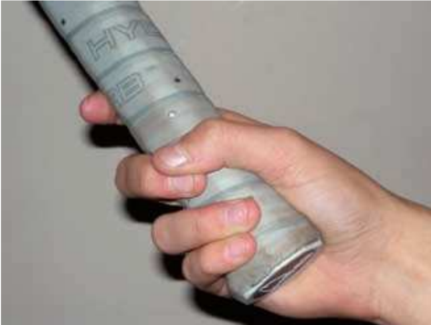
Figura 1 Imatge de com s'agafa la raqueta de tennis (grip).